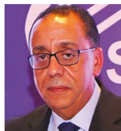
Pr Karim Ouldin

L'agriculture comme la santé le montrent clairement. À mesure que les usages numériques progressent, la question n'est plus seulement de collecter ou d'exploiter des données, mais de fixer un cadre de confiance autour de leur usage, de leur protection et de leur circulation.